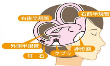
「良性発作性頭位めまい症」は、最も頻度が高いめまい疾患ですが、最も治療しやすいめまい疾患です。